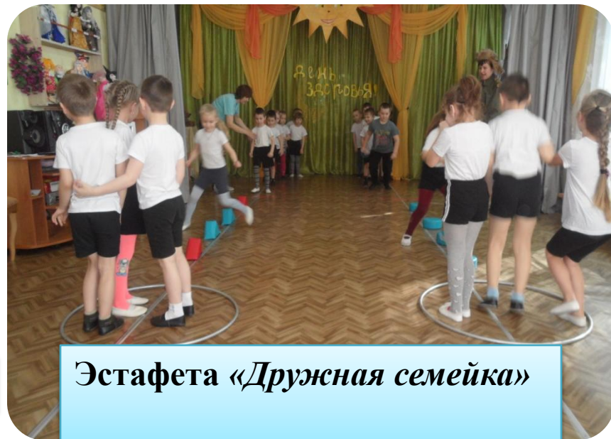
Эстафета «Дружная семейка»