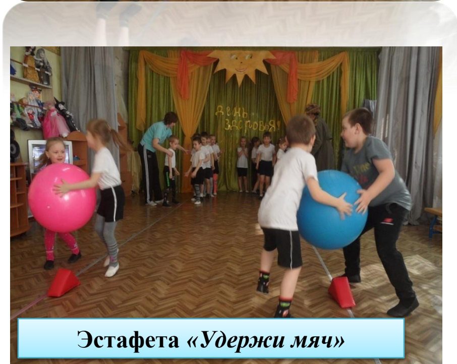
Эстафета «Удержи мяч»