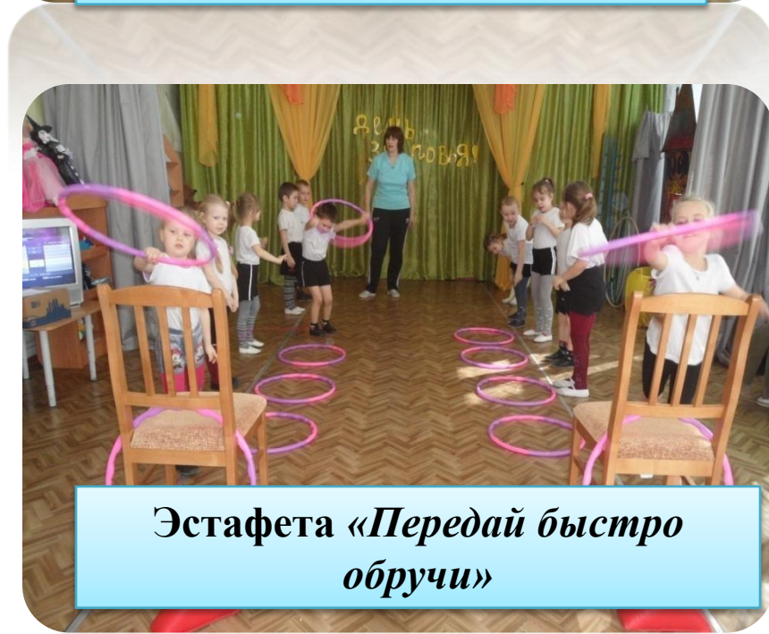
Эстафета «Передай быстро обручи»