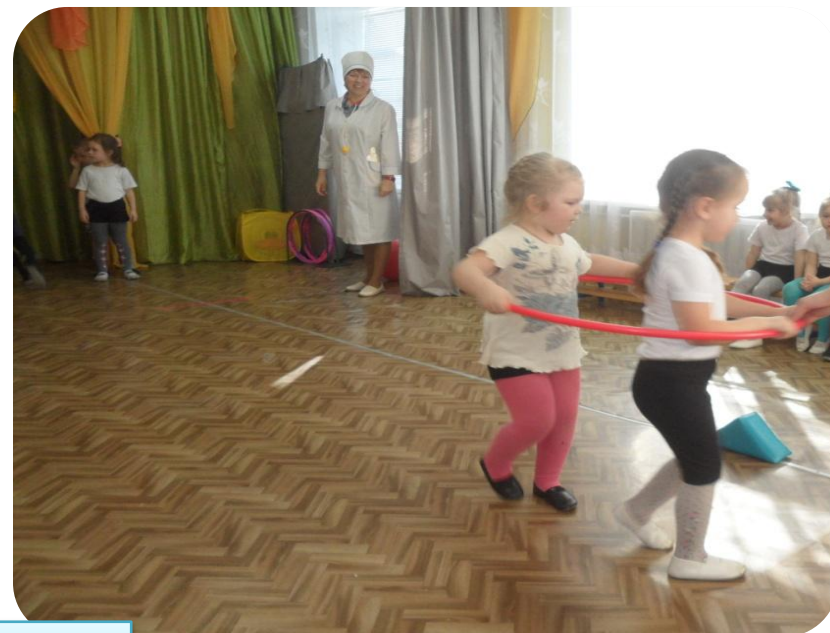
«БЕГ В ОБРУЧЕ ПАРАМИ»