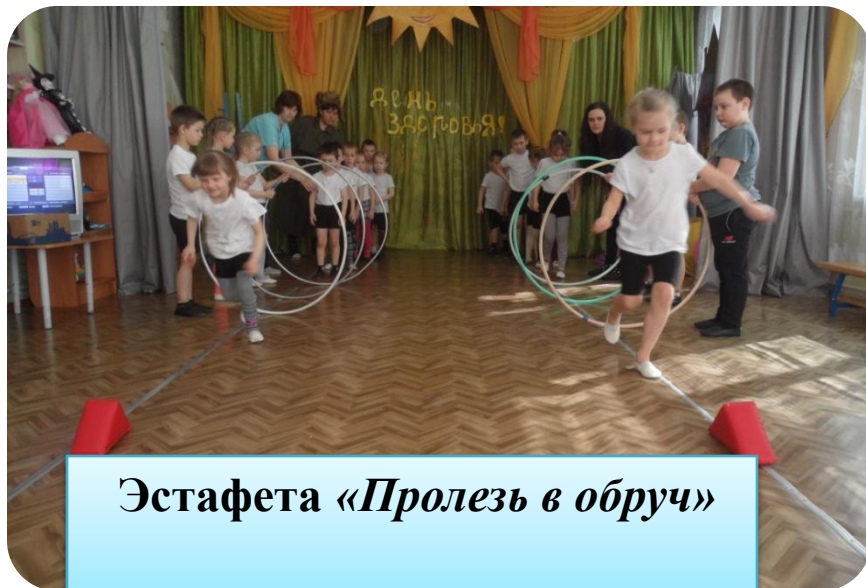
Эстафета «Пролезь в обруч»