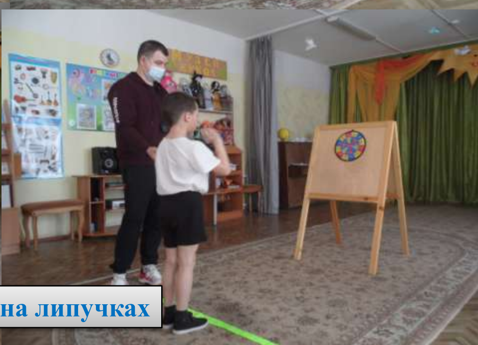
Дартс на липучках