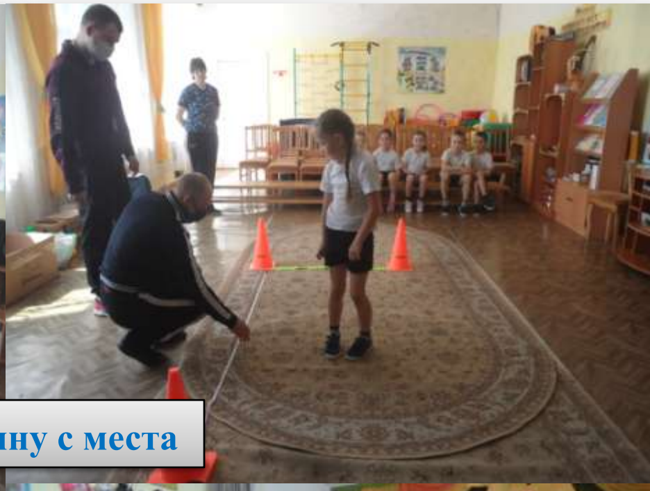
Прыжки в длину с места