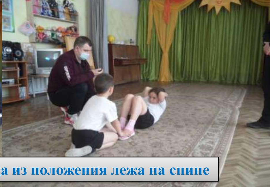
Подъём туловища из положения лежа на спине