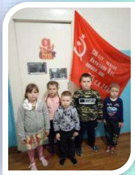
Лэпбук «75 лет без войны»