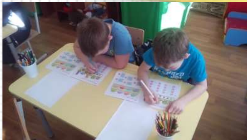
Математическая игра на повторение счета и геометрических фигур