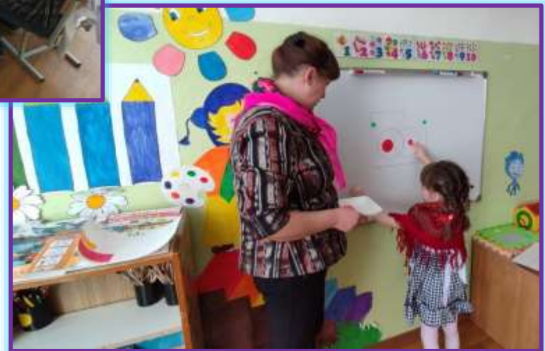
Решаем логическую задачу с помощью технологии «Обручи Столяра»