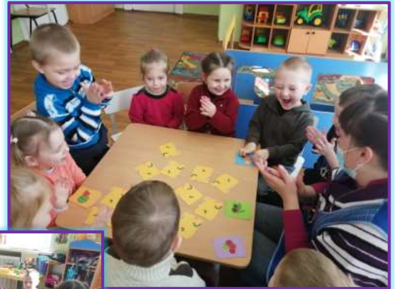
Дидактическая игра «Мемори»