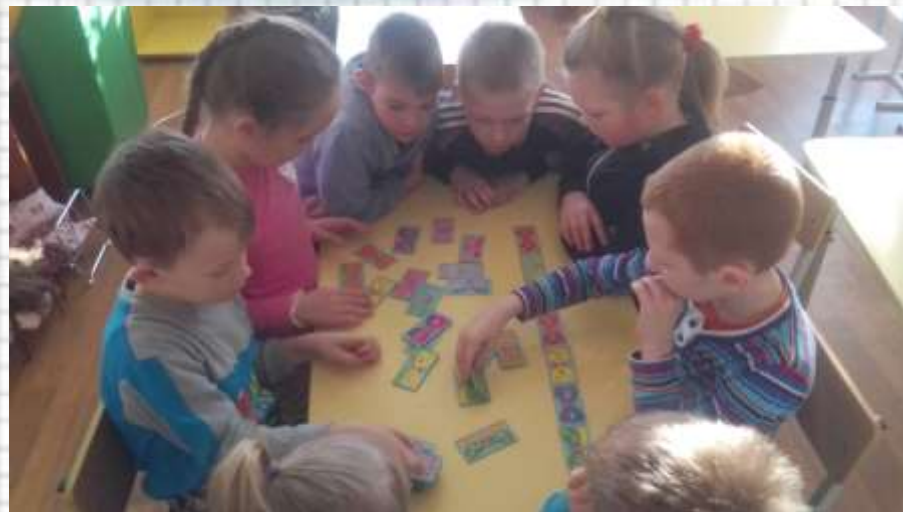
Игра «Закончи строку геометрических фигур»