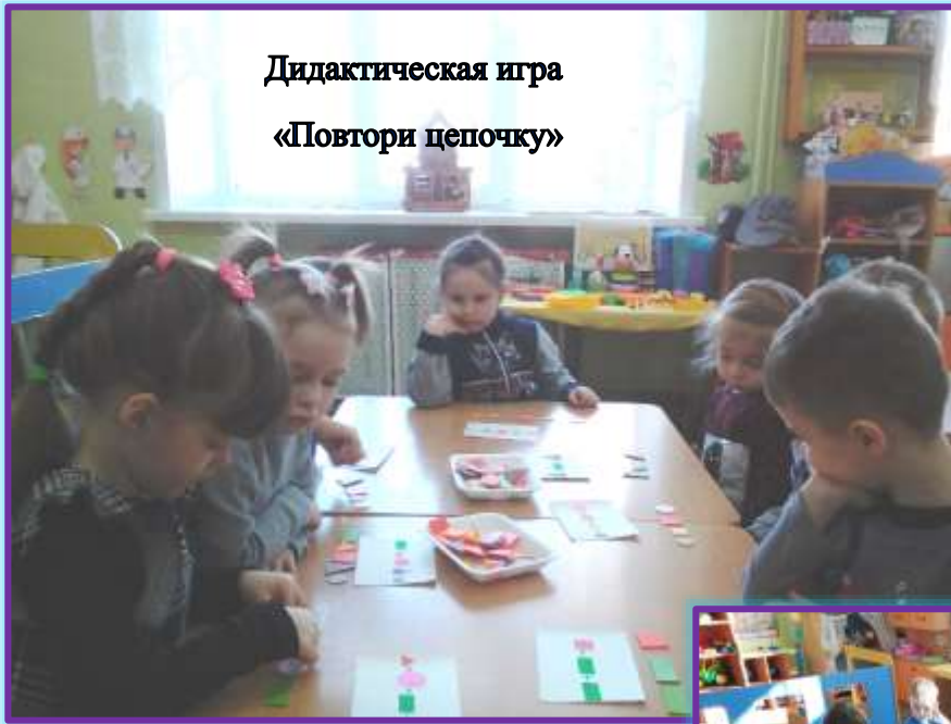
Дидактическая игра «Повтори цепочку»