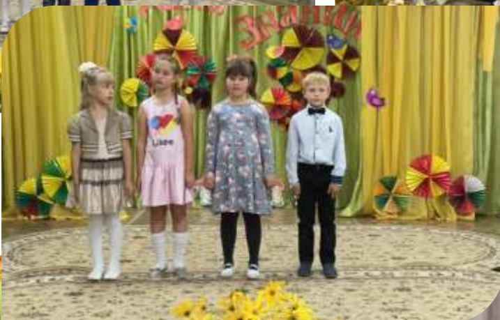
Подарок от воспитанников