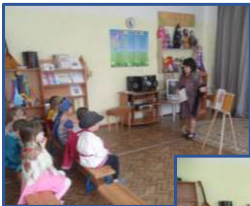
Фото к беседе. Дефиле костюмов.