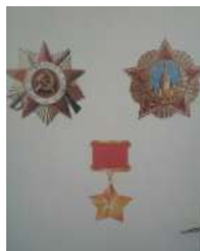
Флаг Победы. Награды.