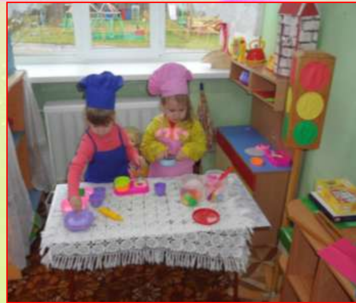
Сюжетно – ролевая игра «Повар»