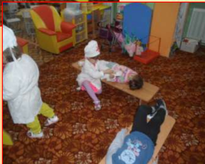
Сюжетно - ролевая игра «На приеме у врача»