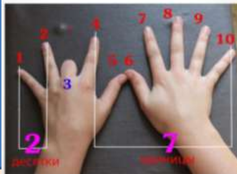
Родительское собрание - практикум