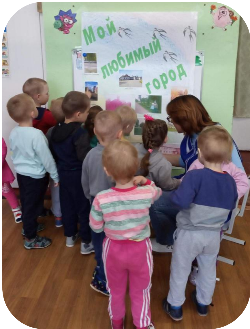
Сюжетная игра «Мой город»

Неделя юных исследователей родного края 15-19 июля в группе раннего возраста. Беседа на тему «Наш родной Красный Холм»